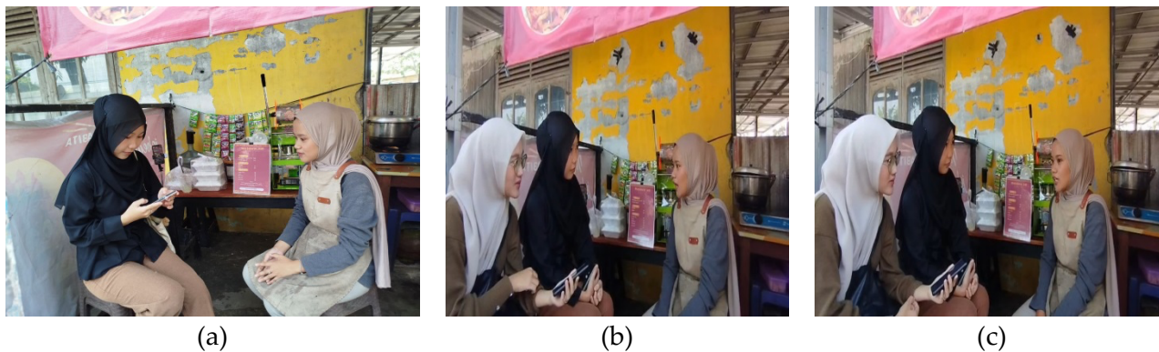
Gambar 1. Wawancara dengan pemilik usaha sekaligus edukasi terkait aplikasi digital BukuKas

Berdasarkan panduan wawancara yang telah disusun, diperoleh data profil usaha bahwa UMKM Mie Jebew telah beroperasi selama kurang lebih dua tahun dengan rata-rata omzet penjualan berkisar antara Rp300.000 hingga Rp500.000 per hari. Usaha ini dikelola oleh tiga orang termasuk pemilik usaha yang sekaligus bertanggung jawab dalam melakukan pencatatan laporan keuangan. Pemilik menyatakan bahwa kendala terbesar yang dihadapi adalah tidak adanya sistem pencatatan yang teratur, sehingga sulit menentukan apakah harga jual yang ditetapkan sudah cukup menutupi seluruh biaya operasional. Temuan ini memperkuat urgensi implementasi aplikasi BukuKas sebagai solusi yang praktis, mudah digunakan, dan tidak memerlukan latar belakang akuntansi formal (Sholikudin et al., 2024).